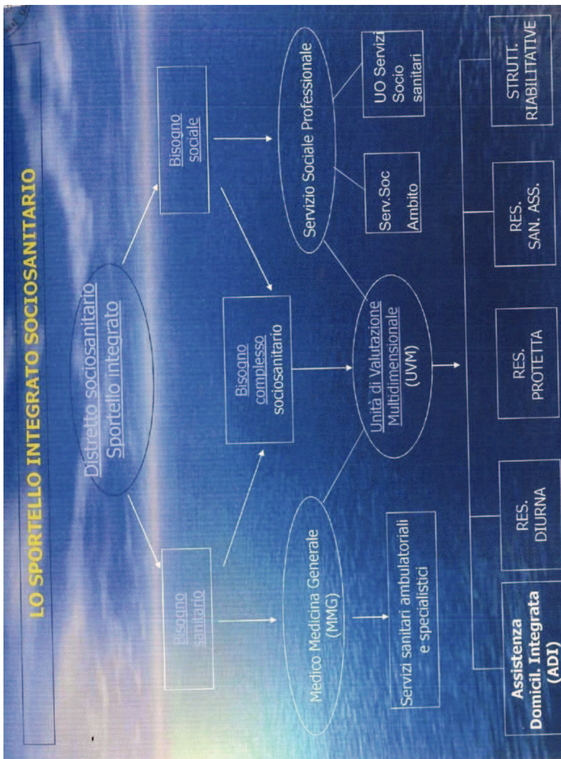
Grafico: “Lo sportello integrativo sociosanitario”