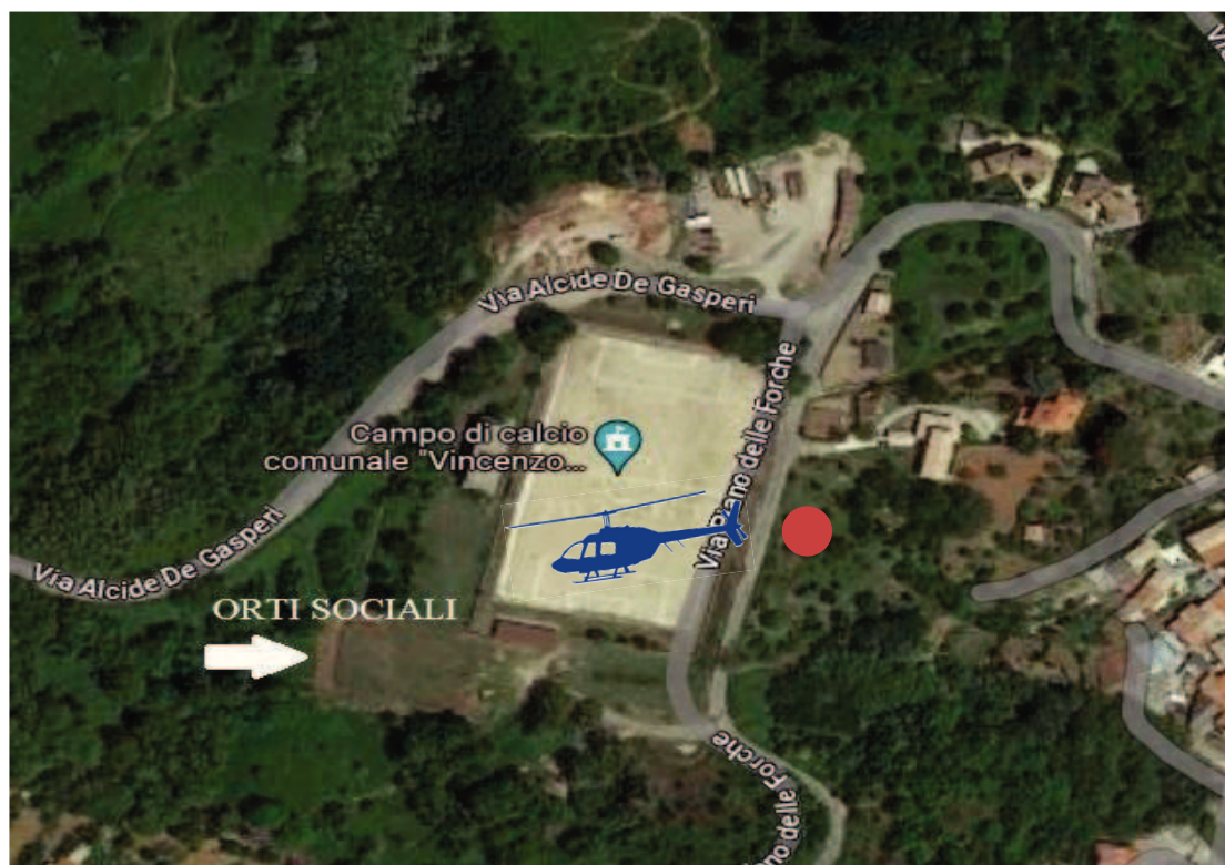
Veduta dall'alto con Google Maps