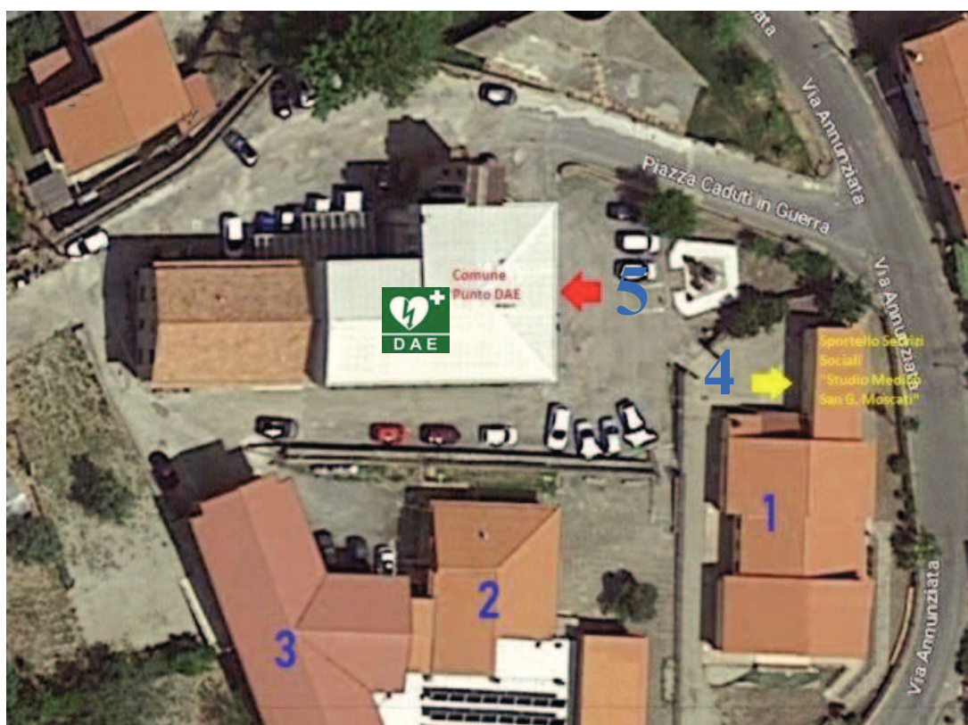
Foto vista dall'alto con Google Maps

Inoltre, all'esterno il Comune è dotato di un defibrillatore automatico e semiautomatico detto anche DAE, di uno Sportello Servizi Sociali locato presso lo studio medico "San Giuseppe Moscati" che eroga diversi servizi e di 3 istituti scolastici: la Scuola dell'Infanzia, la Scuola Primaria e la Scuola Secondaria di primo grado.